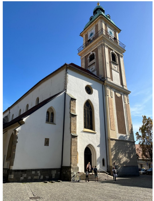
Katedrála Sv. Jana Křtitele