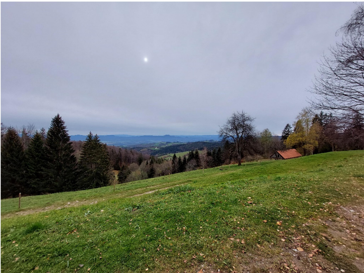
Výlet na Pohorje, Mariborská koča, kde jsme ochutnali místní speciality.