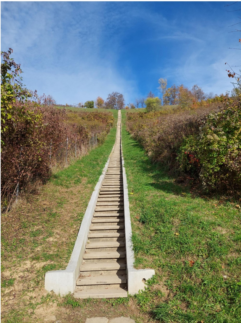
454 schodů na Kalvárii ke svaté Barboře