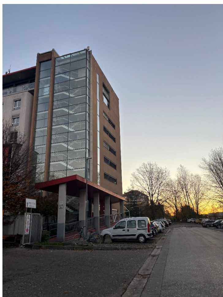
SeneCura Maribor – Dom starejših občanov