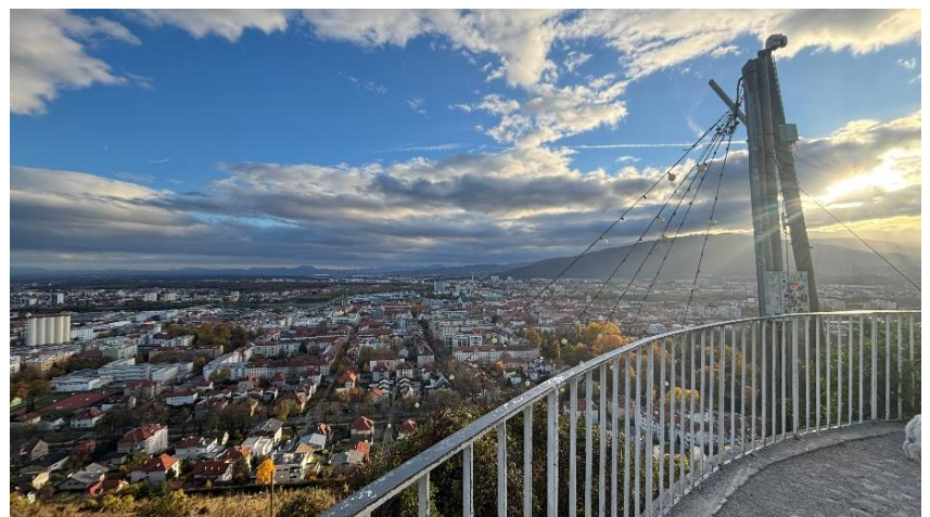
Piramida - kopec nad městským parkem, nádherný výhled na město Maribor, můžeme tam vidět pozůstatky hradu