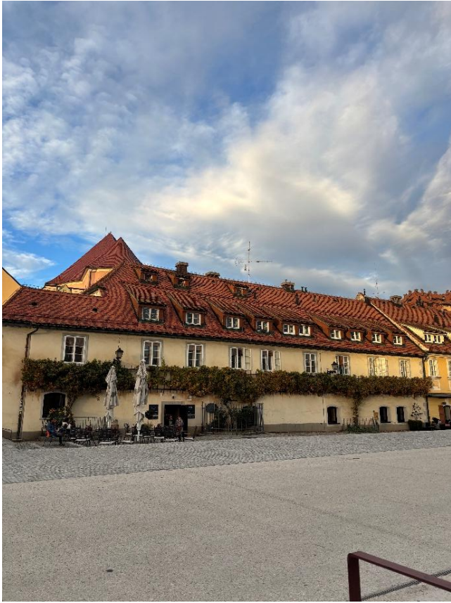
Žametovka - nejstarší plodící vinná réva na světě - odhadováno je 400 let