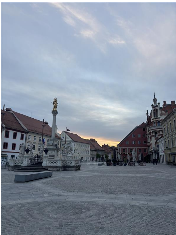
Glavni trg - náměstí v Mariboru s morovým sloupem