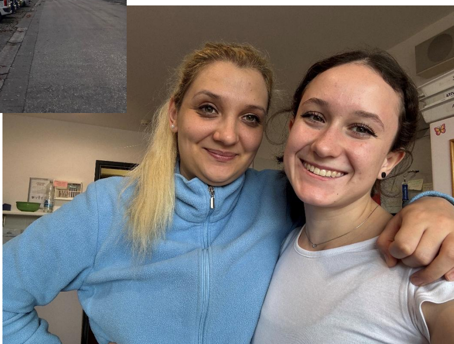
Já s mojí oblíbenou pracovnící v domově