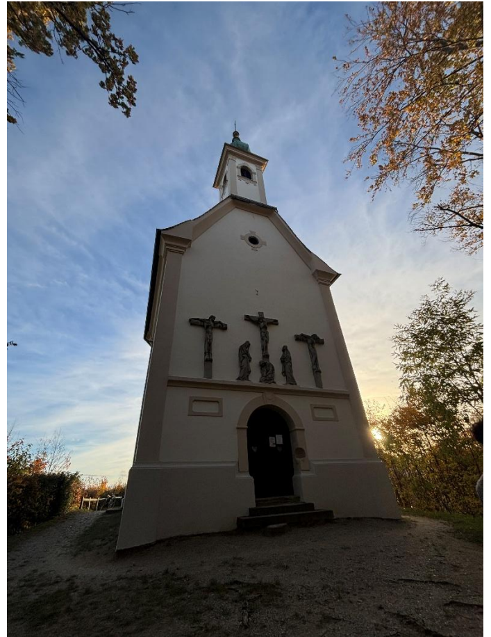
Cerkev sv. Barbare - stojí na kopci Kalvarija - cesta tam vede přes překrásné vinice