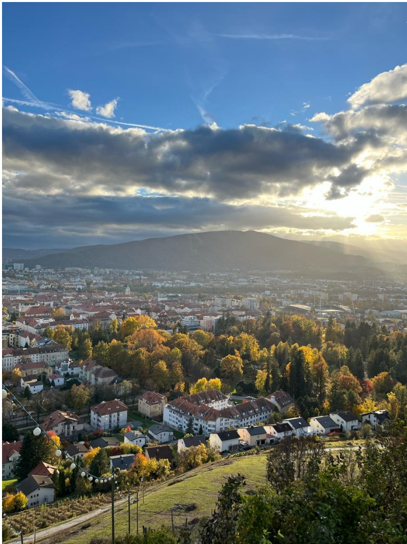
Odpolední výšlap na kopečky v Mariboru – Kalvarija a Piramida