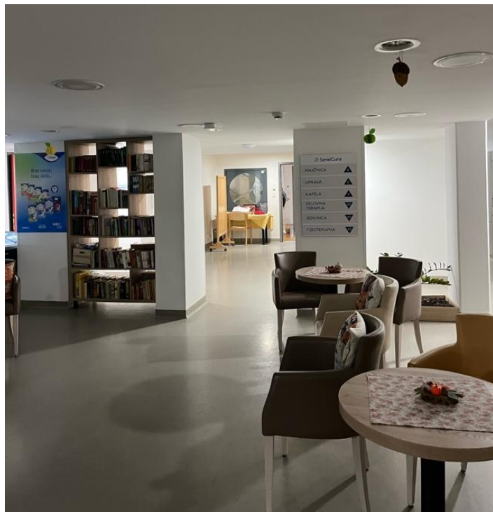
Prostory domova pro seniory SeneCura Maribor (vrchní fotky jsou hlavní příchozí hala a spodní jsou z oddělení)