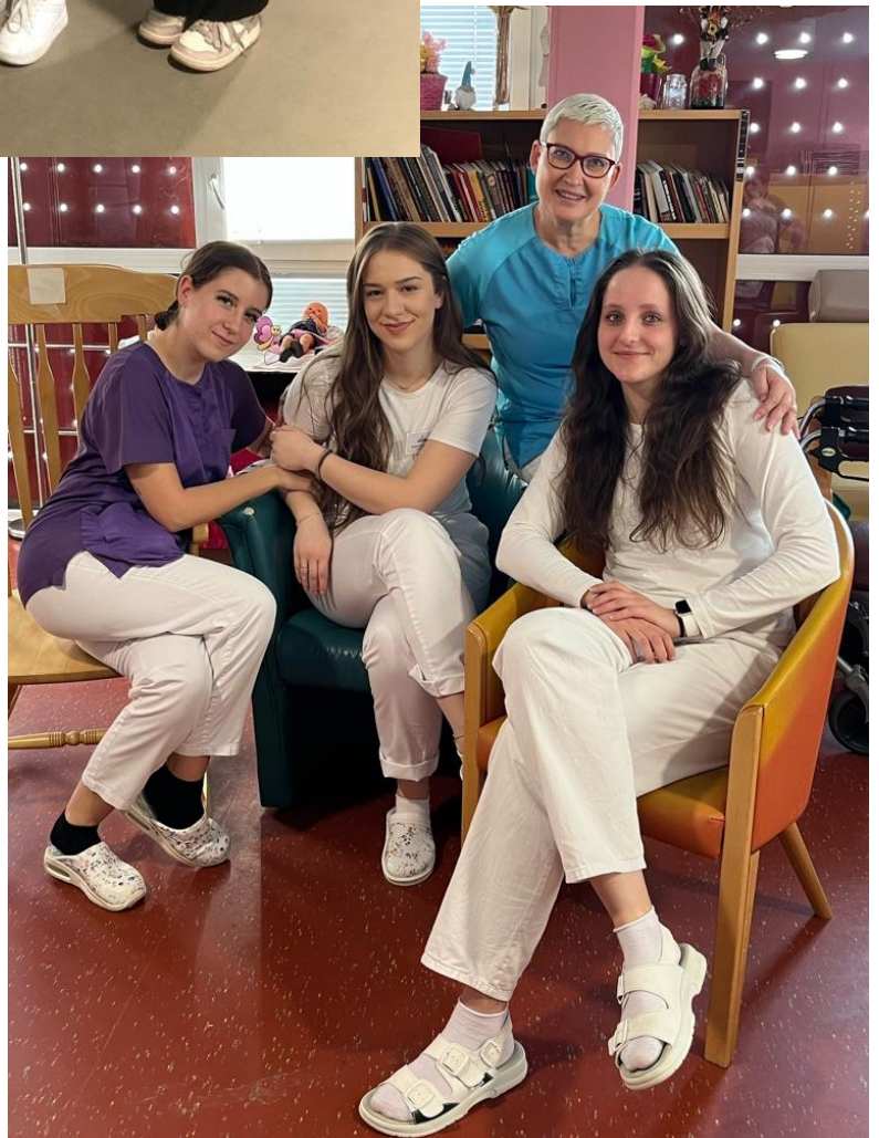
Ošetřovatelky ze 4.patry, které mi s čímkoliv pomáhaly