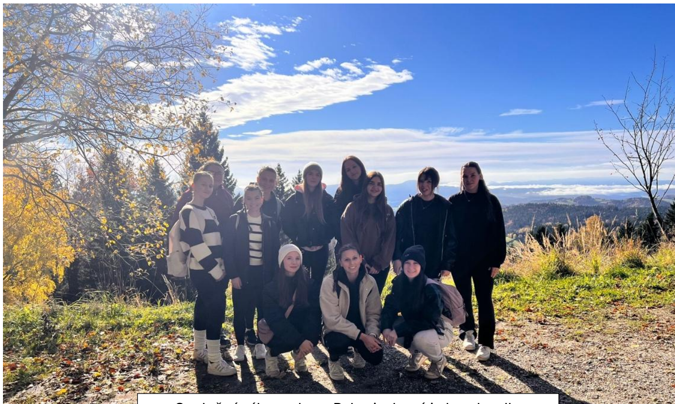
Společný výlet na horu Pohorje, která je hned vedle Mariboru