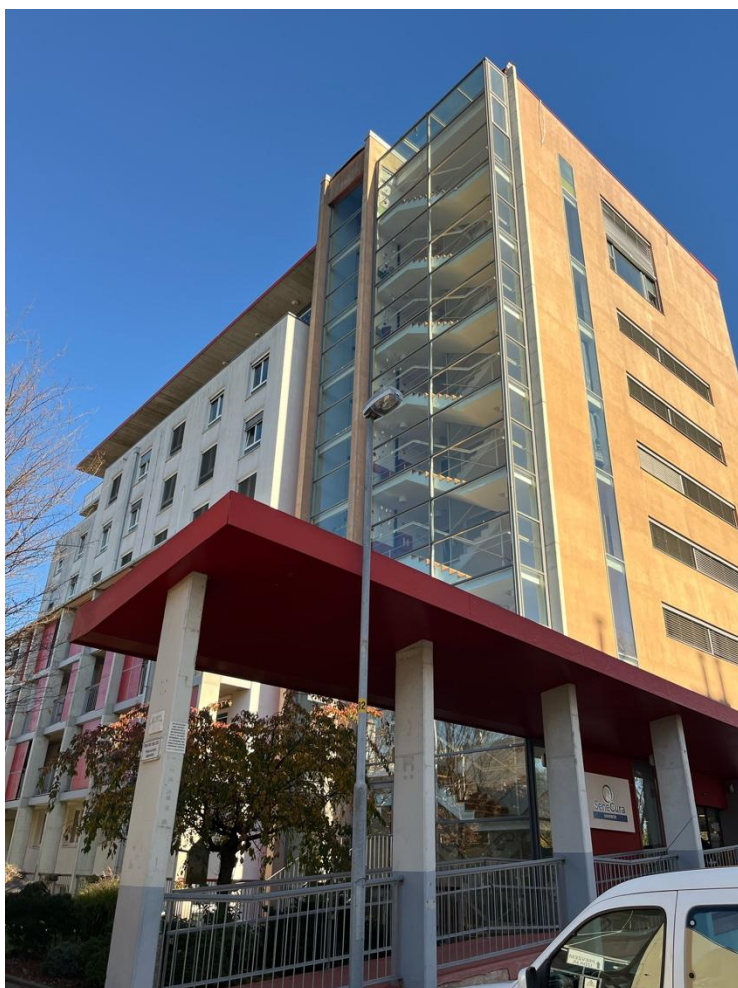
Domov pro seniory SeneCura Maribor zvenku