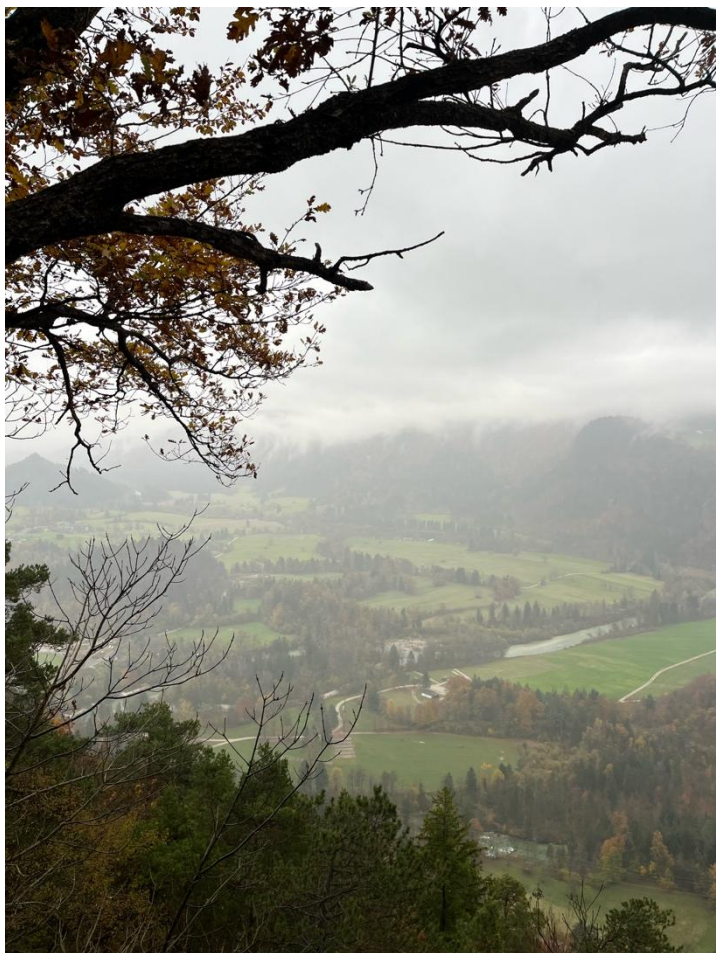
Samostatný výlet k jezeru Bled, vzdáleného cca 180 km od Mariboru