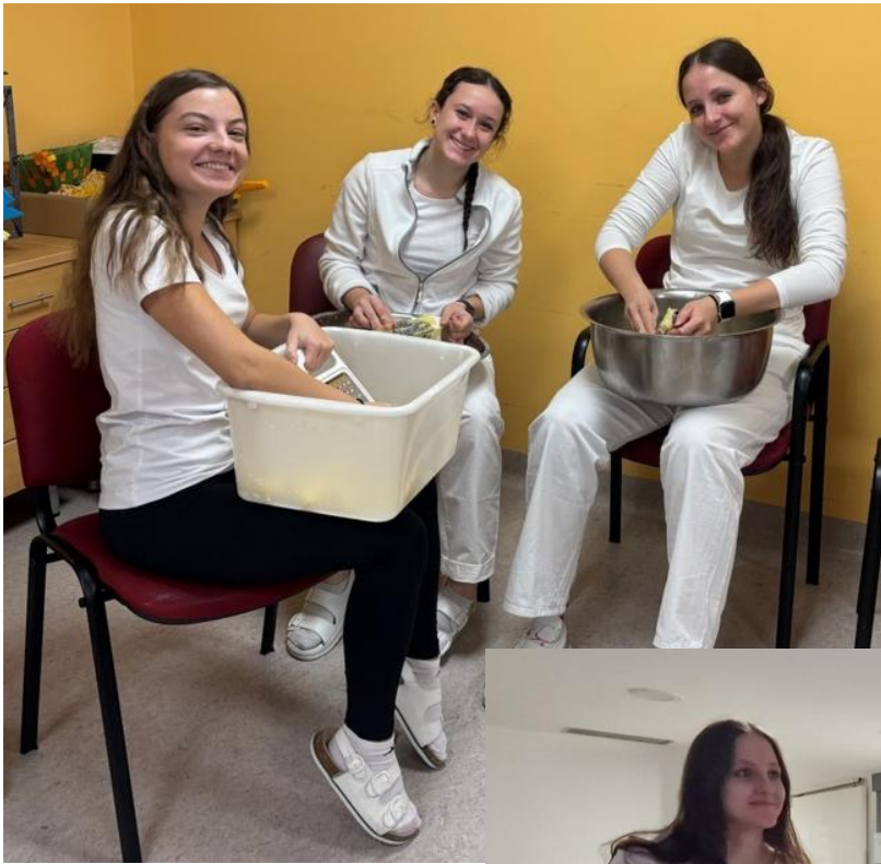
Český den strávený společně s klienty z celého domova