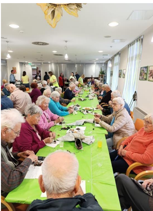
Snídaně v rámci ergoterapie