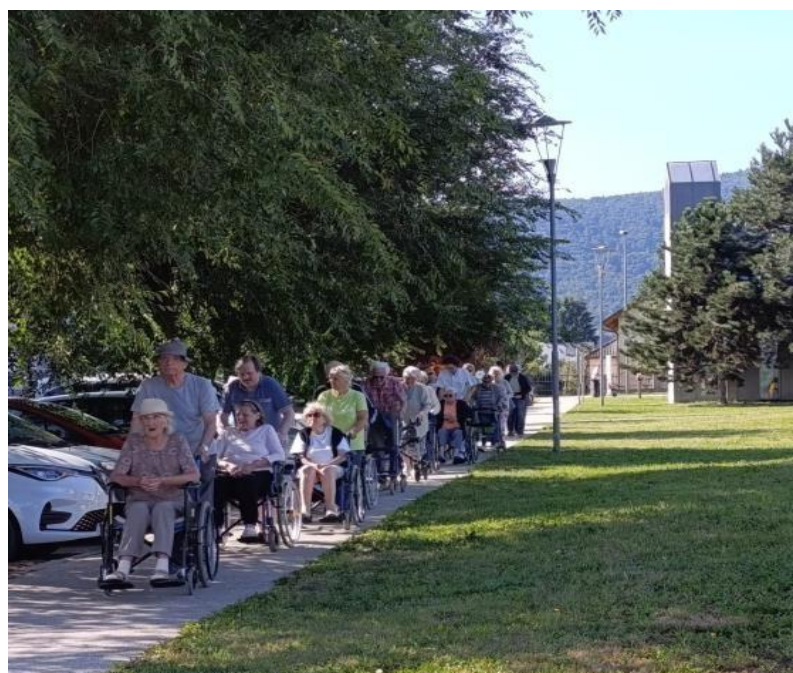
Společné aktivity klientů