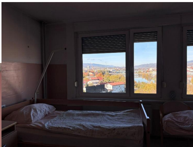
Fotky ze zařízení