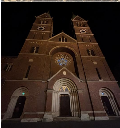
Františkánský kostel sv. Marie