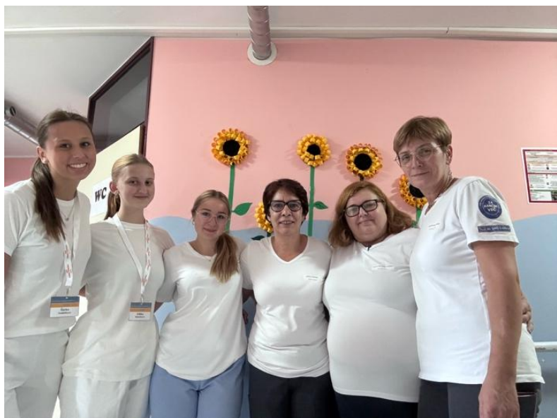
Fotka s kolegyněmi