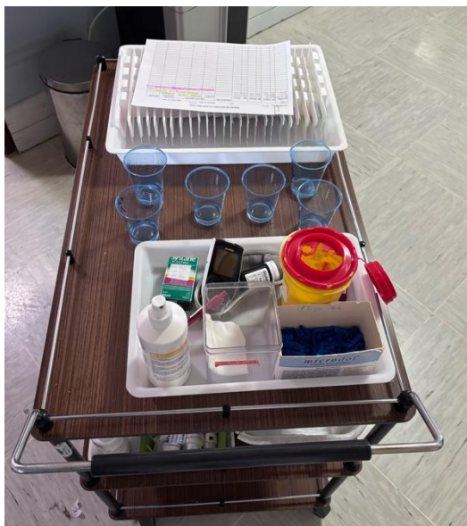
Vozík na podávání léků