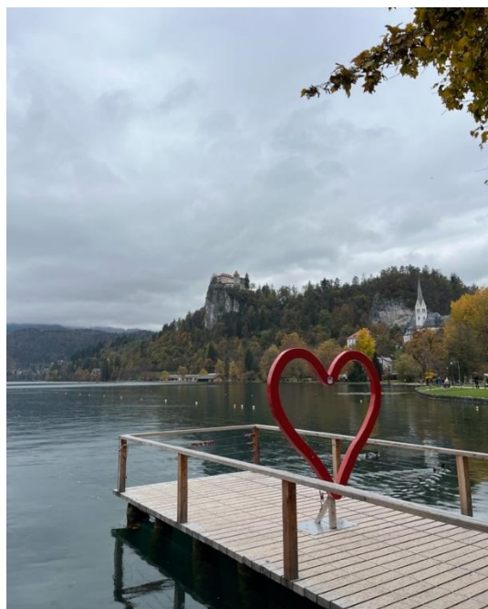
Jezero Bled a Bledský hrad