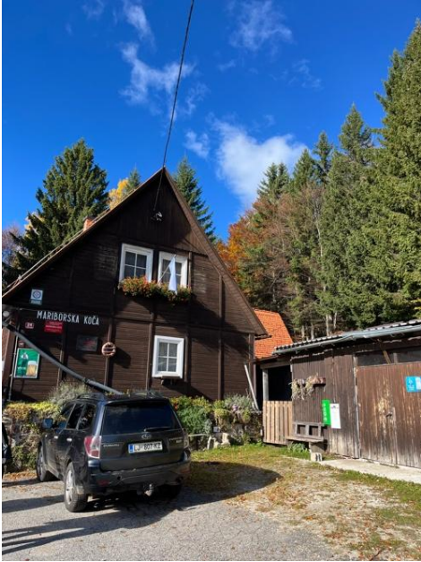
Pohorje Mariborska koča