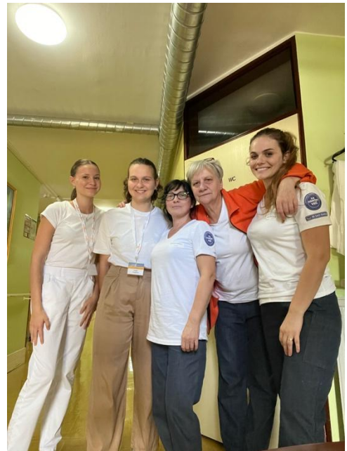
Fotka s personálem