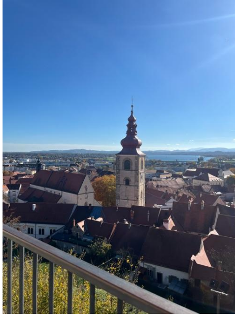
historické město Ptuj