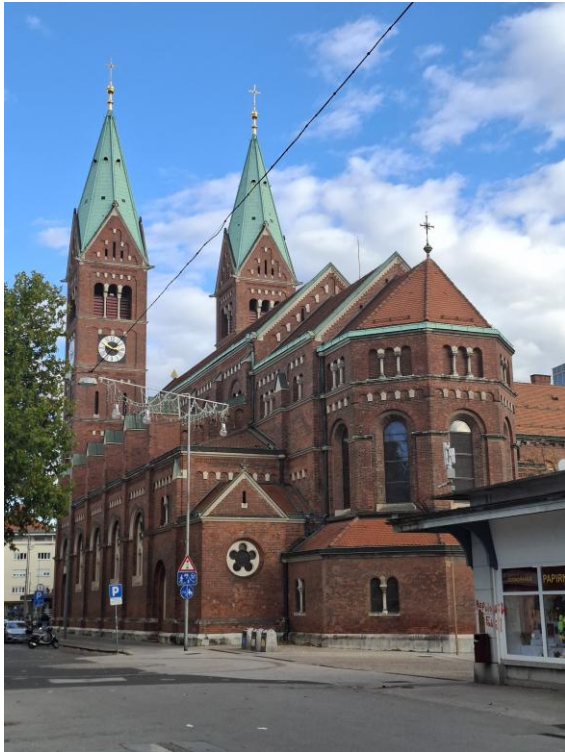
Bazilika Matky Milosrdenství