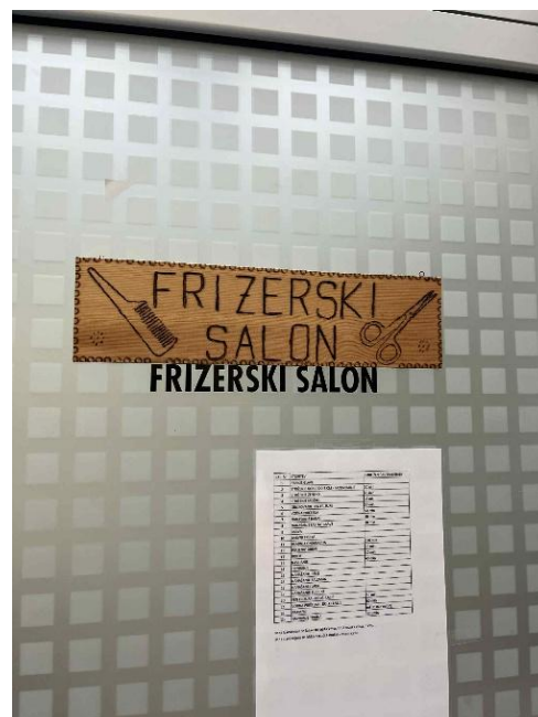
Kadeřnictví v DSO