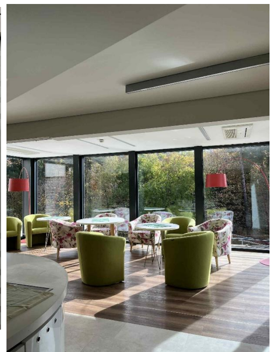
jídelna v Zelené ulici