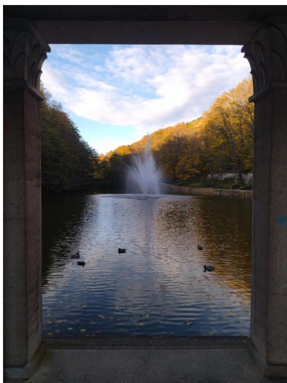
Arkade trije ribniki