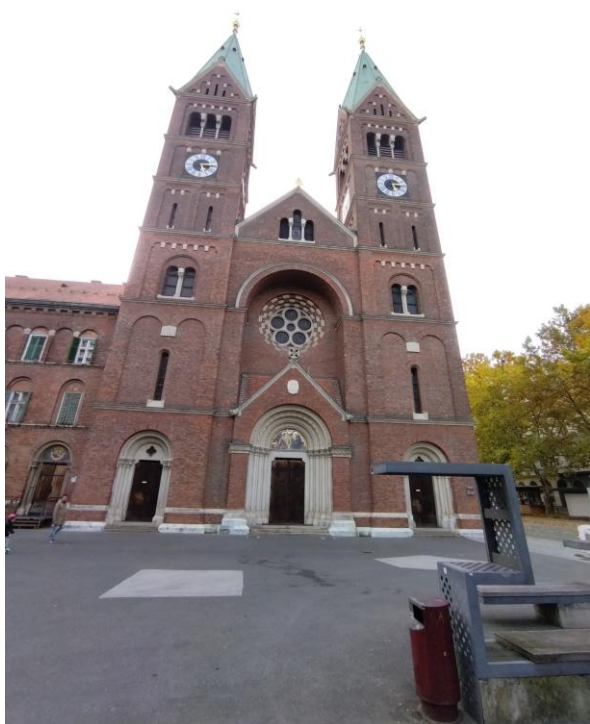
Františkánský kostel v Mariboru