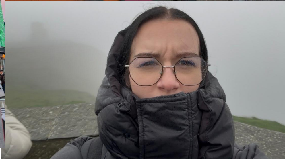
Špatné počasí na Cliffs of Moher