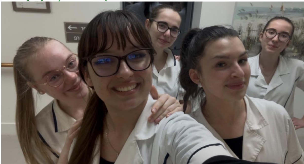
Společné foto v Nazareth House