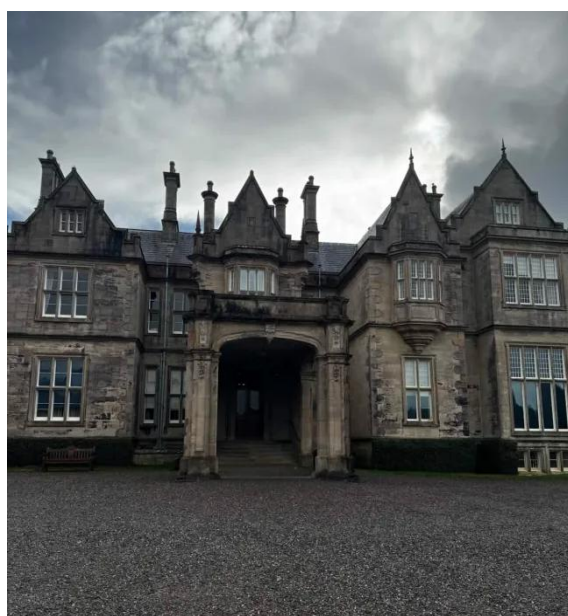
Fotky k národnímu parku Killarney: