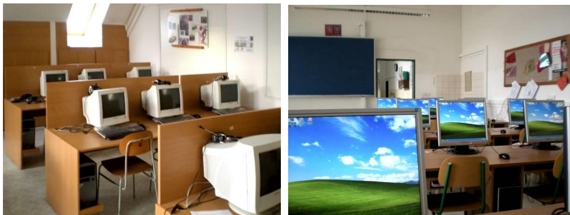
Obrázek č.12 a 13 Učebna výpočetní techniky