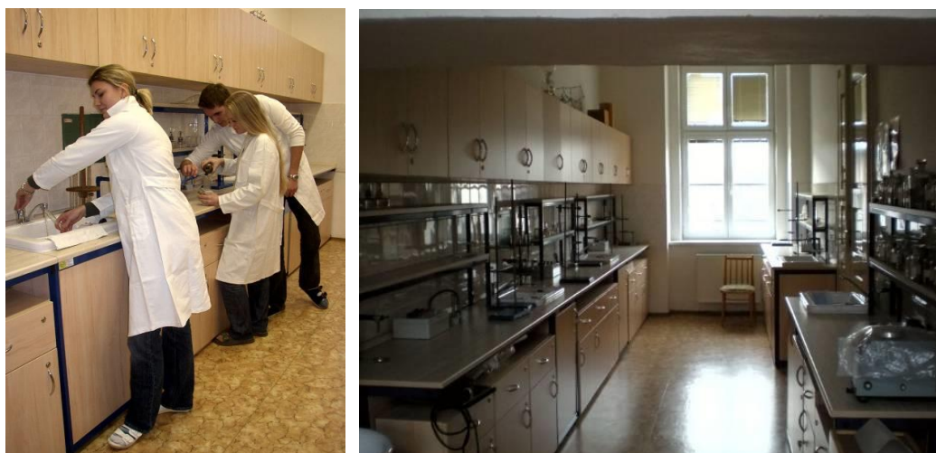
Obrázek č.14 a 15 Laboratoř chemie a fyziky