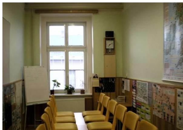
Obrázek č.10 a 11 Jazykové učebny