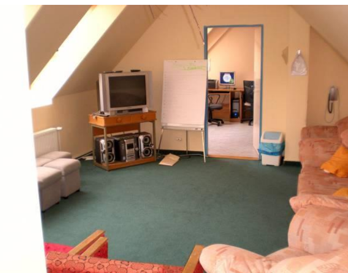
Obrázek č.18 a 19 Knihovna a učebna psychologie