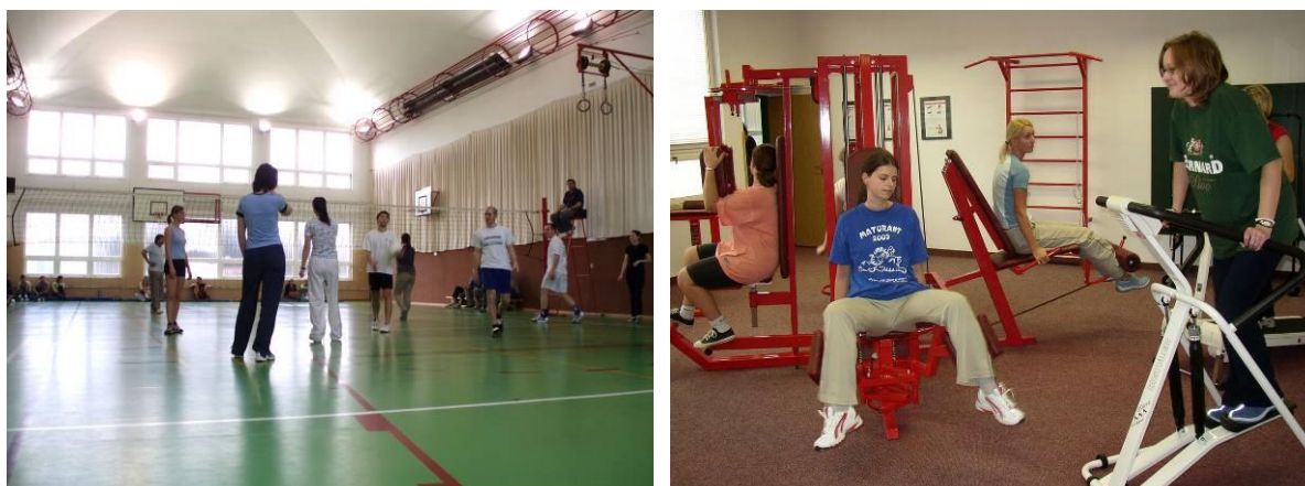
Obrázek č.16 a 17 Tělocvična a posilovna