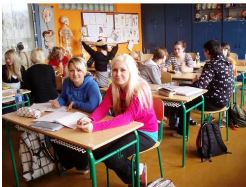
Obrázek č.7 Učebna somatologie