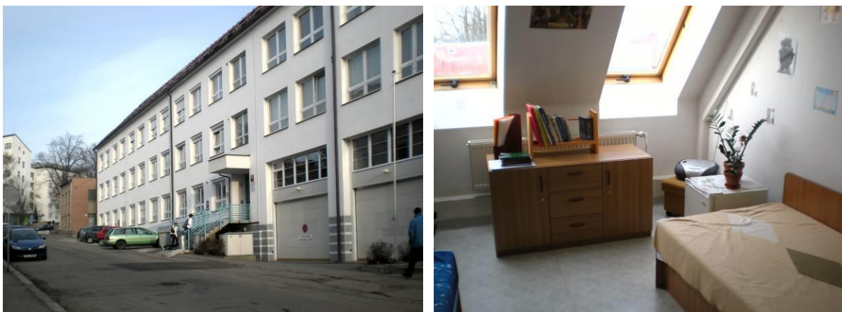
Obrázek č.3 a 4 Domov mládeže

Škola sídlí v budově na Masarykově ulici č. p. 2033 v Havlíčkově Brodě. Tato budova je v majetku kraje Vysočina. Domov mládeže a školní jídelna – výdejna jsou v Husově ulici č. p. 3023 v areálu Nemocnice Havlíčkův Brod a jsou v majetku Nemocnice Havlíčkův Brod (majetkový odbor kraje Vysočina zřídil věčné břemeno ve prospěch Domova mládeže v souladu se smlouvou o sdružení finančních prostředků).