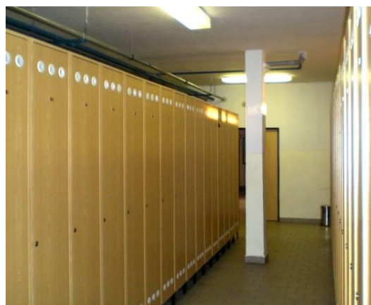
Obrázek č.20 a 21 Kinosál a šatny pro žáky