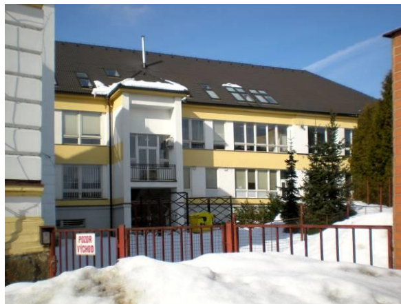
Obrázek č.1 a 2 Budova školy