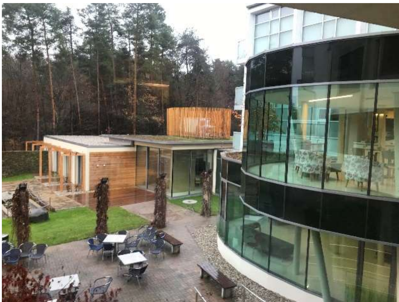
Výhled z jednolůžkového pokoje v DSO Tezno na zahradu domova