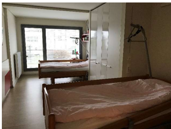
Dvojlůžkový pokoj v DSO Tezno