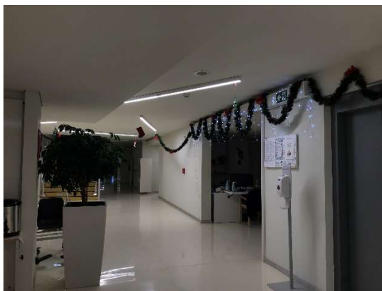
Chodba v DSO Tezno