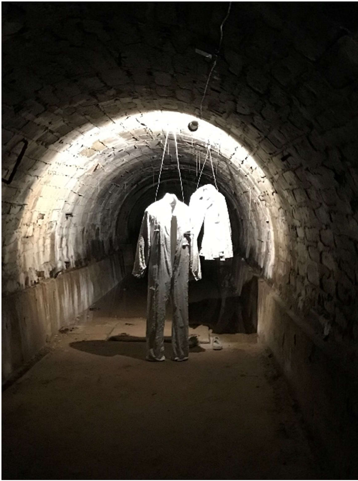
Podzemní tunely Tezno