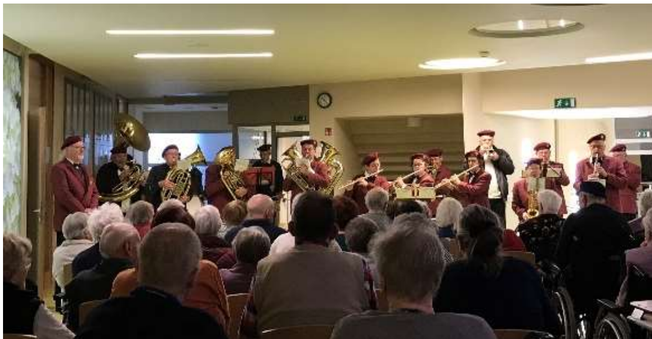
Koncert dechové hudby pro seniory v DSO Tezno