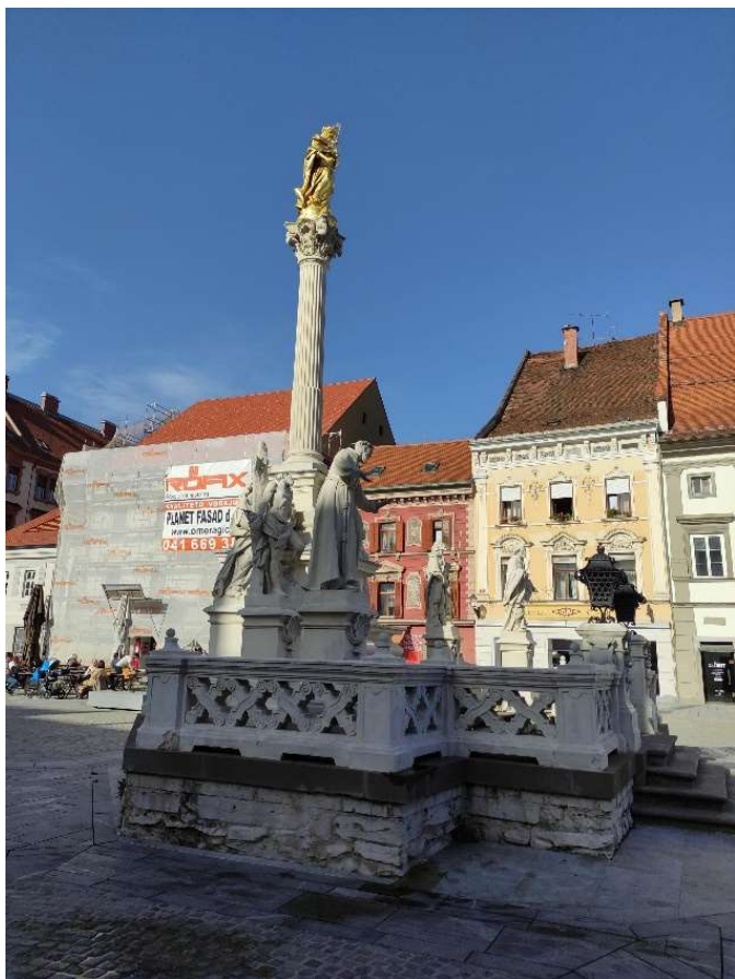
Hlavní náměstí v Mariboru - Védový morový sloup