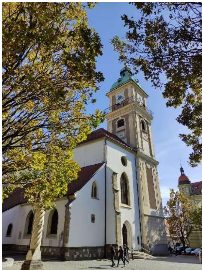
Katedrála sv. Jana Křtitele